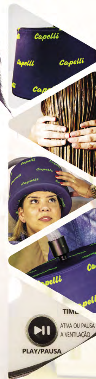
Painel do Freddo

Acionar no painel do Freddo a tecla "PAUSE", terminando o tratamento e mantendo o equipamento em espera para próximo tratamento. Retirar gentilmente o Capelli do paciente. O tratamento está completo.