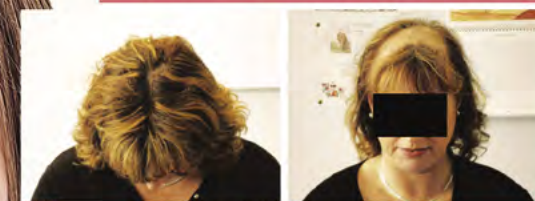
Foto real do resultado falho no uso dessas toucas

Como se trata de resfriamento por contato, através de uma serpentina de silicone, este método não se acopla em 100% do couro cabeludo, para maioria dos pacientes. São muito comuns as reclamações da existência de partes calvas em meio a manutenção do cabelo. Além do fato de que a touca, para manter o acoplamento, deve ter um ajustamento perfeito, algo pouco conseguido durante todo o tratamento.